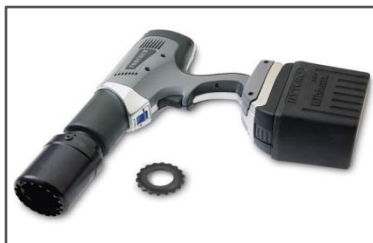
Compatible con la revolucionaria Arandela HYTORC

La más alta proporción potencia-peso de cualquier batería de pistola de torque. Los componentes de alta calidad garantizan un rendimiento y durabilidad superiores. Su estructura de aluminio hace que sea ligero pero resistente a los daños.