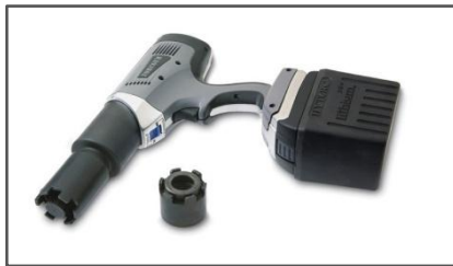
Compatible con la Tuerca HYTORC™ con Avanzados Tensionadores de Sujeción.