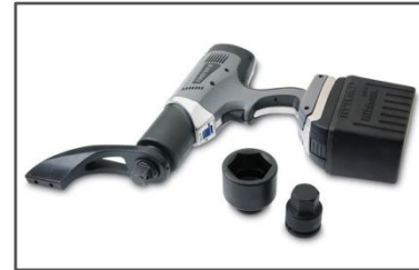
Trabaja con accesorios de reacción HYTORC.